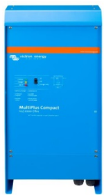
MultiPlus Compact 12/2000/80

Quattro poate fi folosit în la panourile fotovoltaice (PV) conectate sau nu la rețea și la alte sisteme alternative de energie. Software-ul de detectare a pierderii rețelei este disponibil.