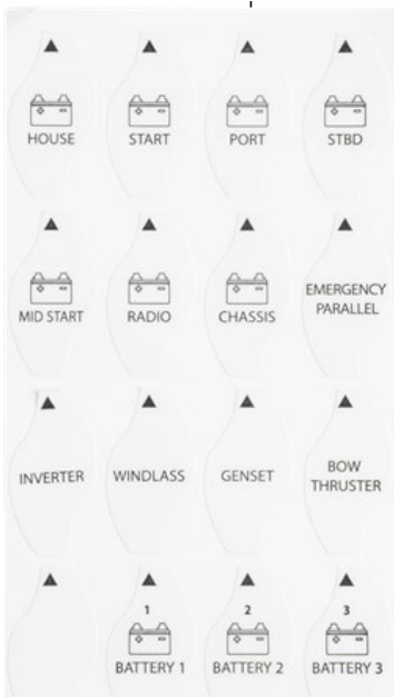
Autocolante cu etichete

Butonul rotativ este demontabil, în scopuri de izolare sau siguranță. Comutatorul de baterie îndeplinește cerințele standardului de protecție împotriva aprinderii ISO8846 și este potrivit pentru utilizare în camera motorului.